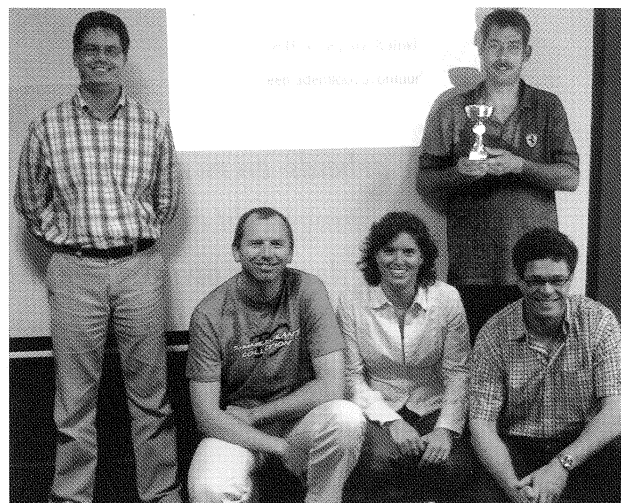
De ondernemingsraad van Sonneveld ging uiteindelijk met de beker naar huis.

Wat heb je als or aan zo'n game? Omdat elke opdracht een ander karakter draagt, worden alle kwaliteiten van het or-team getest. Een groot team heeft als voordeel dat, mits goed aangestuurd, subgroepen aan deelopdrachten kunnen werken. Het kleine or-team heeft als voordeel dat de besluitvorming snel verloopt en groepsprocessen eenvoudiger zijn. De or-game is een vernieuwende manier van